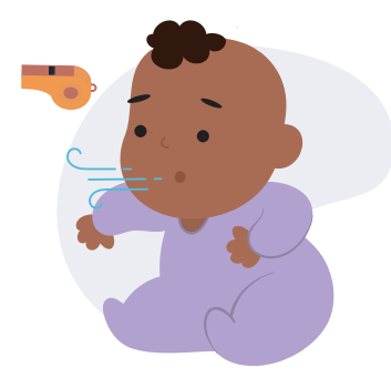
Chiado no peito

O vírus sincicial respiratório é um vírus sazonal altamente contagioso que pode levar a internações para alguns bebês e crianças.