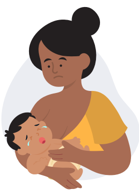
Dificuldade de alimentação