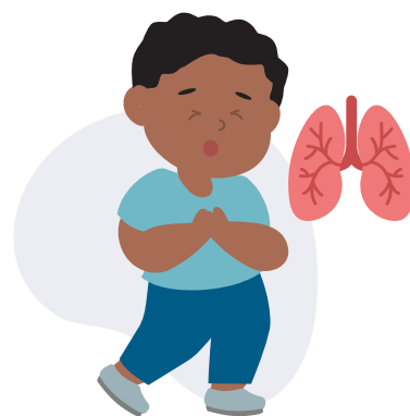
Dificuldade de respiração (o osso do peito afunda quando respira)